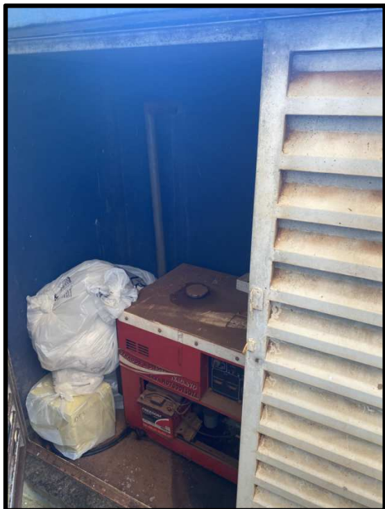
ARMAZENAMENTO DE RESÍDUOS BIOLÓGICOS