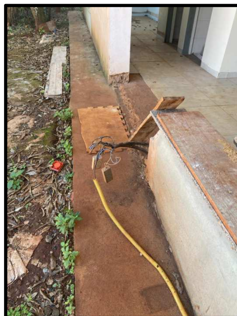
INSTALAÇÃO ELÉTRICA EXTERNA IMPROVISADA

CEREST – Avenida Professor Jorge Correa, nº 876 – Centro – Araraquara – SP. CEP: 14801-230 Fones: (16) 3331-6277 / 3331-6232, e-mails: gcerest@araraquara.sp.gov.br / cerest@araraquara.sp.gov.br