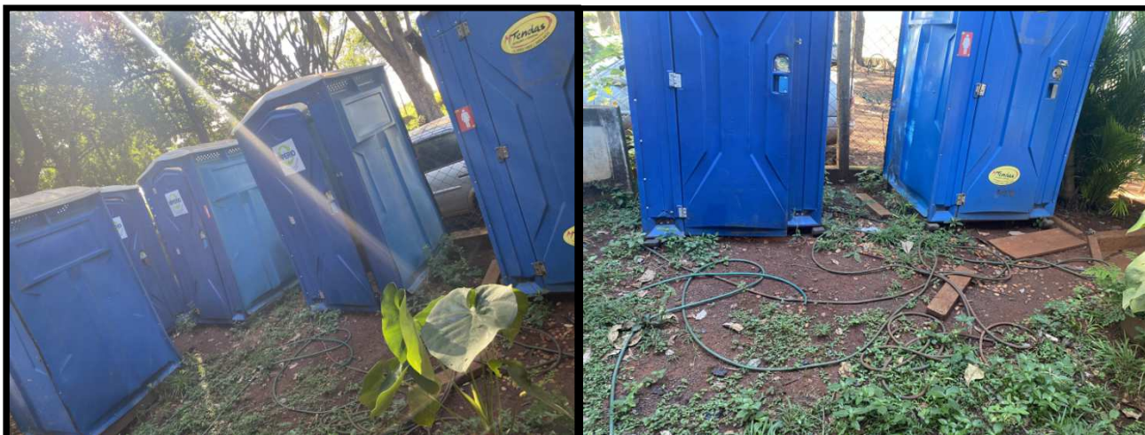
BANHEIROS QUÍMICOS DISPONÍVEIS NA ENTRADA DA UNIDADE