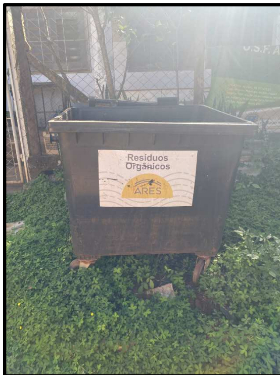
ARMAZENAMENTO DE RESÍDUOS ORGÂNICOS