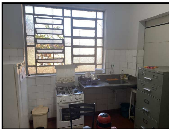
COPA E ÁREA DE REFEIÇÃO