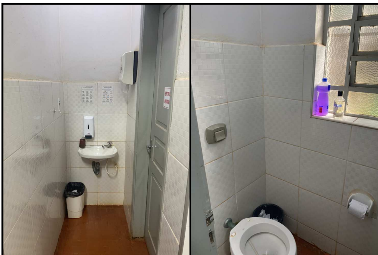
ÚNICA INSTALAÇÃO SANITÁRIA DISPONÍVEL NO INTERIOR DA UNIDADE

CEREST – Avenida Professor Jorge Correa, nº 876 – Centro – Araraquara – SP. CEP: 14801-230 Fones: (16) 3331-6277 / 3331-6232, e-mails: gcerest@araraquara.sp.gov.br / cerest@araraquara.sp.gov.br