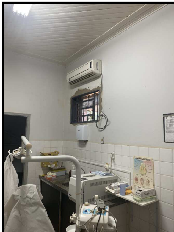
SALA DE ODONTOLOGIA