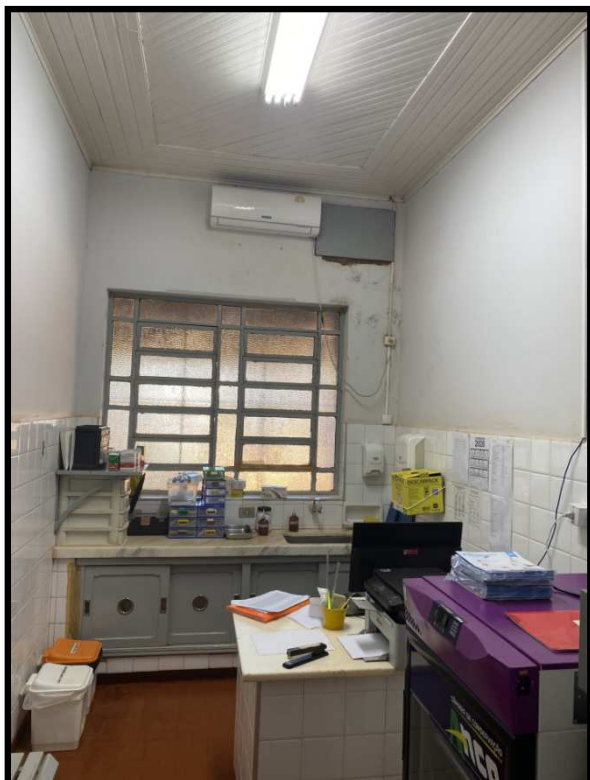
SALA DE VACINAÇÃO